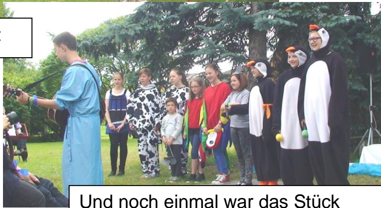
Und noch einmal war das Stück „An der Arche um Acht“ zu erleben