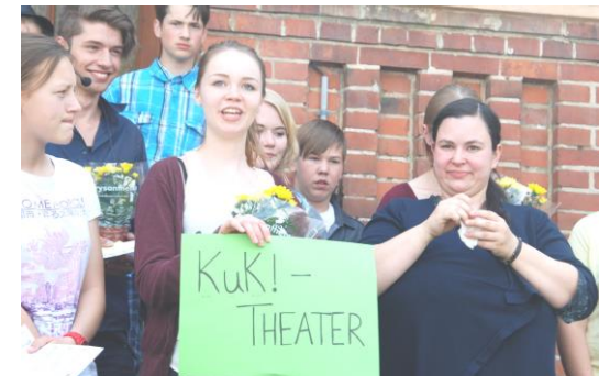
Namensgebung zum Jubiläum