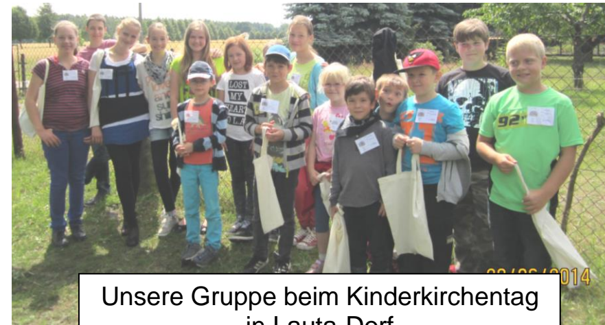
Unsere Gruppe beim Kinderkirchentag in Lauta-Dorf