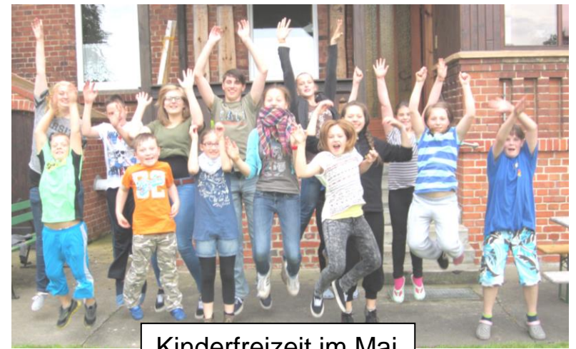
Kinderfreizeit im Mai