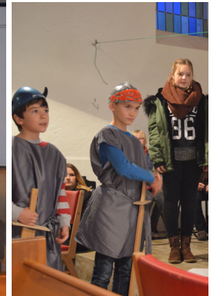
Martinsfest mit unser Theatergruppe