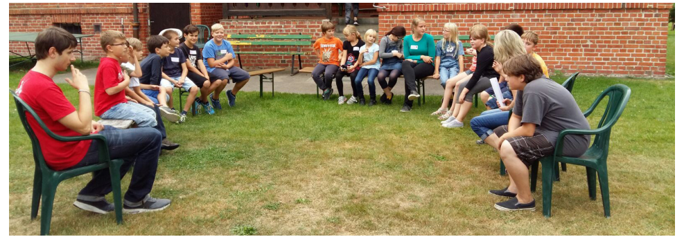
Spaß und Spannung bei der Bibellesenacht