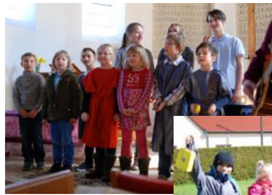
Familien-Ostergottesdienst und Ostereiersuchen In Klein Döbbern