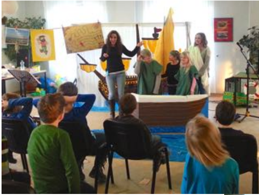
„Schiff Ahoi“ Kindertage im Bürgerhaus Groß Obnig