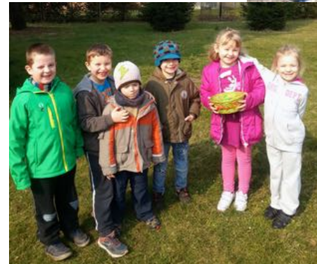
Unsere Kinder vom Spatzenclub