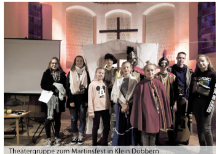
Theatergruppe zum Martinsfest in Klein Döbbern