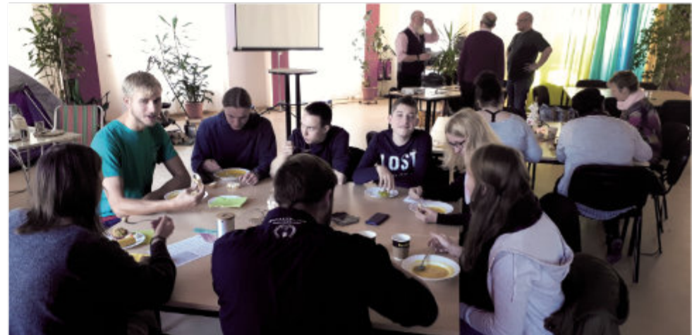
Unser Projekt „Basislager“ im Bürgerhaus war für die Gemeinde und Gäste eine Bereicherung