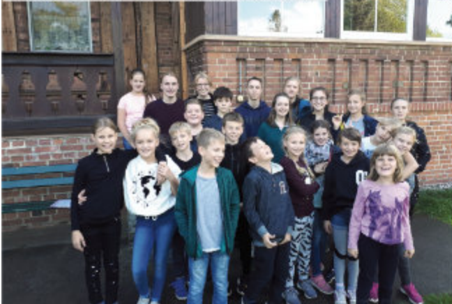
Die Bibellesenacht war wieder ein Erlebnis.