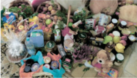
Unsere Gäste vom Helen-Keller-Haus freuten sich über die vielen schönen Erntegaben.